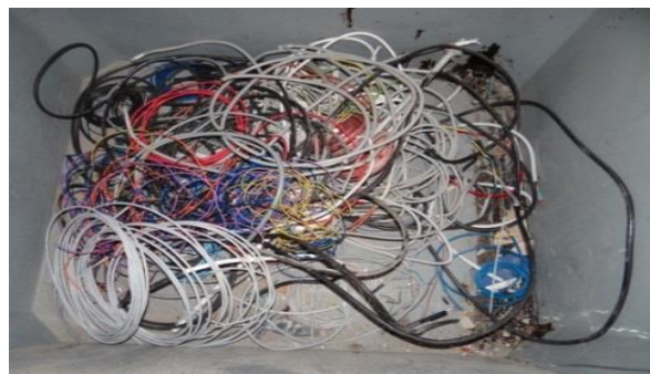
Abb. 1: Altkabel, mit Flammschutzmittel behandelt