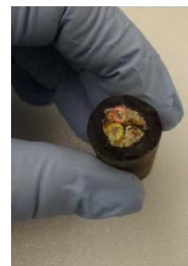
Abb. 3: Querschnitt